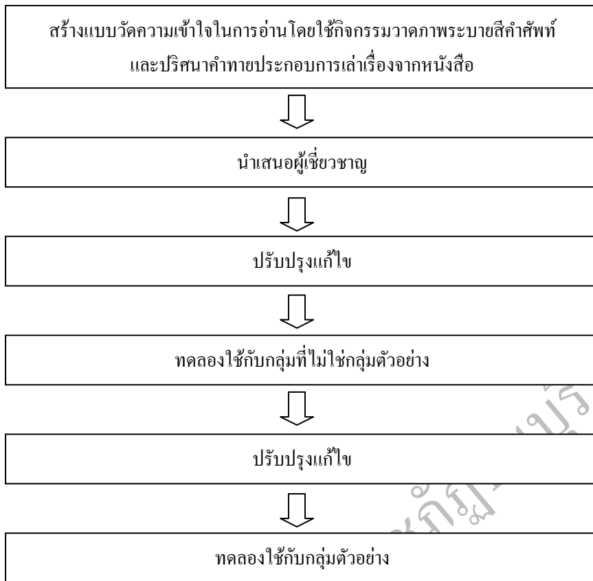
ภาพที่ 3.2 กรอบในการสร้างแบบวัดความเข้าใจในการอ่าน โดยใช้กิจกรรมวาดภาพระบายสีคำศัพท์และปริศนาคำทายประกอบการเล่าเรื่องจากหนังสือ