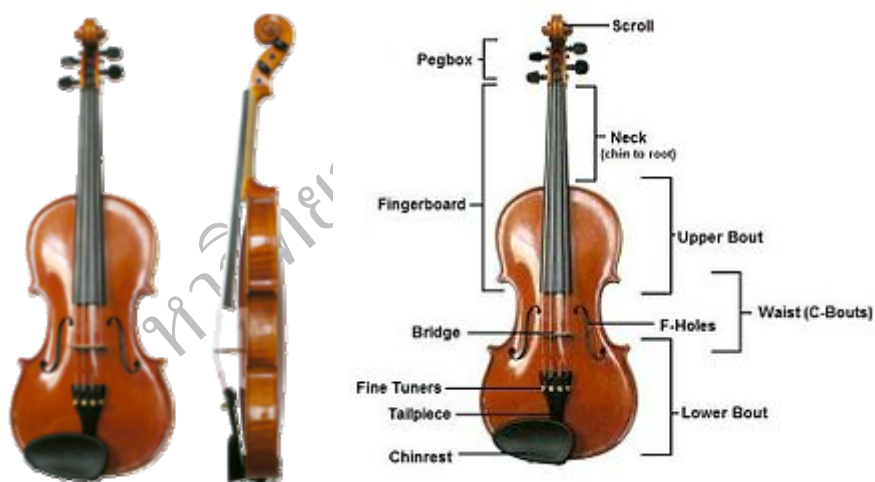
ภาพที่ 2.1 เครื่องดนตรีไวโอลิน

1) ไวโอลิน (violin) ไวโอลินคันหนึ่งๆ ประกอบด้วยแผ่นไม้หลายชิ้น แต่ละชิ้นเลือกมาจากไม้ชนิดต่างๆ กันตามความเหมาะสมที่จะนำมาทำเป็นส่วนต่างๆ ของไวโอลิน ด้านหน้าใช้ไม้พฤษซึ่งเป็นไม้เนื้ออ่อนมีลายละเอียด ด้านหลังใช้ไม้เมเปิ้ล