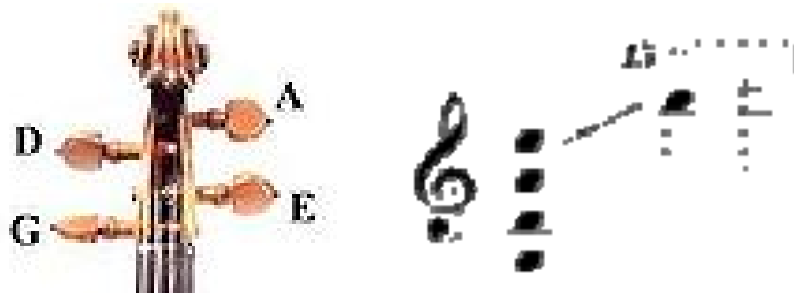
ภาพที่ 2.2 ไวโอลินสาย 4 สาย