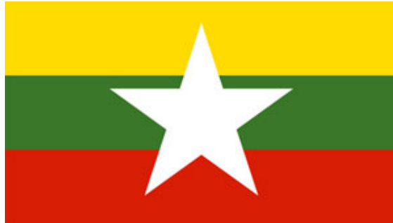
ภาพที่ 2.5 ธงชาติ ตราแผ่นดินประเทศพม่า

ธงชาติพม่า ได้แบ่งตามความยาวออกเป็น 3 ส่วน และมีความกว้างเท่าๆ กัน โดยแต่ละส่วน มีสีที่แตกต่างกัน ไล่จากบนลงล่าง คือ สีเหลือง สีเขียว และสีแดง ขณะที่กึ่งกลางธง มีรูปดาว 5 แฉก สีขาวขนาดใหญ่ ซึ่งสี และสัญลักษณ์ ต่างๆ มีความหมาย ดังนี้