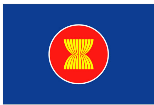
ภาพที่ 2.1 ธงอาเซียน

ประเทศสมาชิก 10 ประเทศ สีเหลือง หมายถึง ความเจริญรุ่งเรือง สีแดงหมายถึง ความกล้าหาญและ การมีพลวัต สีขาวหมายถึง ความบริสุทธิ์ และสีน้ำเงินหมายถึง สันติภาพและความมั่นคง (กรม อาเซียน กระทรวงต่างประเทศ, 2554)