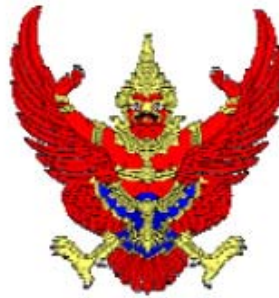
ตราแผ่นดิน