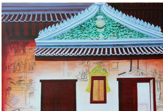
ภาพที่ 183 ผลงานสร้างสรรค์จิตรกรรม ชั้นที่ 5