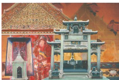
ภาพที่ 176 แบบร่างจากวัดกัลยาณมิตรวรมหาวิหาร 03