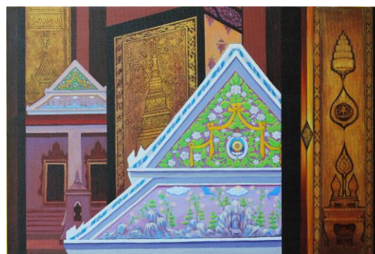
ภาพที่ 182 ผลงานสร้างสรรค์จิตรกรรม ชั้นที่ 4