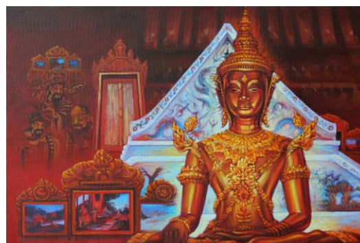
ภาพที่ 180 ผลงานสร้างสรรค์จิตรกรรม ชั้นที่ 2