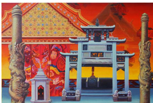
ภาพที่ 181 ผลงานสร้างสรรค์จิตรกรรม ชั้นที่ 3