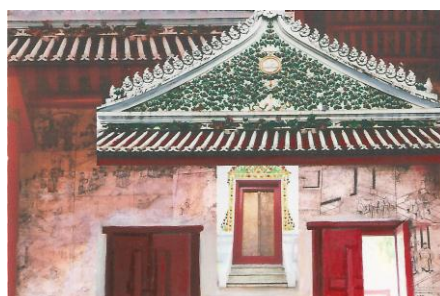
ภาพที่ 178 แบบร่างจากวัดประเสริฐสุทธารวาส 03