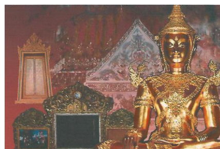
ภาพที่ 175 แบบร่างจากวัดนางนองวรวิหาร 03