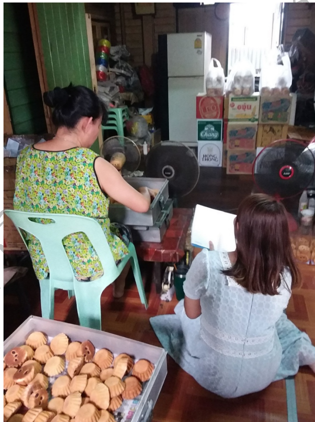
ภาพที่ 7 บรรยากาศขณะสัมภาษณ์เจ้าของร้านขนมฝรั่งกุฎีจีนหลานแม่เป่า