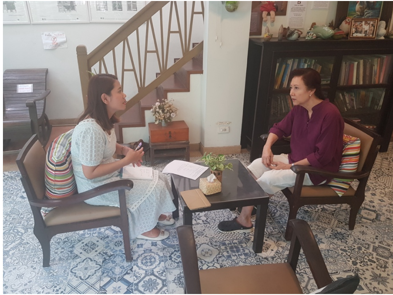
ภาพที่ 6 บรรยากาศขณะสัมภาษณ์เจ้าของพิพิธภัณฑ์บ้านกุฎีจีน