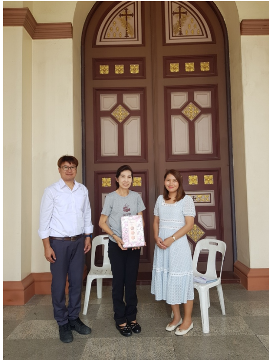
ภาพที่ 4 บรรยากาศขณะสัมภาษณ์ประธานชุมชนกุฎีจีน