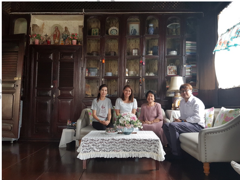
ภาพที่ 5 บรรยากาศขณะสัมภาษณ์เจ้าของเรือนจันทนภาพ เรือนไม้โบราณ