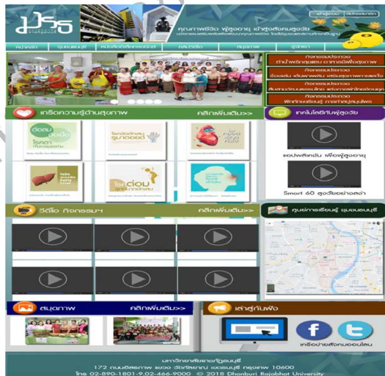
ภาพที่ 3.2 หน้าแรกของเว็บไซต์คุณภาพชีวิตผู้สูงอายุ เข้าสู่สังคมสูงวัย

4) พัฒนาเว็บไซต์คุณภาพชีวิตผู้สูงอายุ เข้าสู่สังคมสูงวัยตามกำหนด โดยการใช้เทคโนโลยี และระบบการจัดการฐานข้อมูลในการนี้ ผู้วิจัย เลือกใช้ Adobe dream weavers 6 ในการพัฒนาร่วมกับ โค้ดจาวาสคิปต์ (JavaScript code) และเบราว์เซอร์ HTML 5 ภายในกิจกรรมจะประกอบไปด้วย e -book, Social Media, Social Network และเชื่อมต่อกับฐานข้อมูล MySQL ด้วยโค้ด PHP พร้อมทั้งทำการทดสอบการทำงานเพื่อหาข้อผิดพลาด (Bug) และจัดทำคู่มือการใช้งานของเว็บไซต์คุณภาพชีวิตผู้สูงอายุ เข้าสู่สังคมสูงวัยเพื่อความสะดวกต่อการใช้งาน