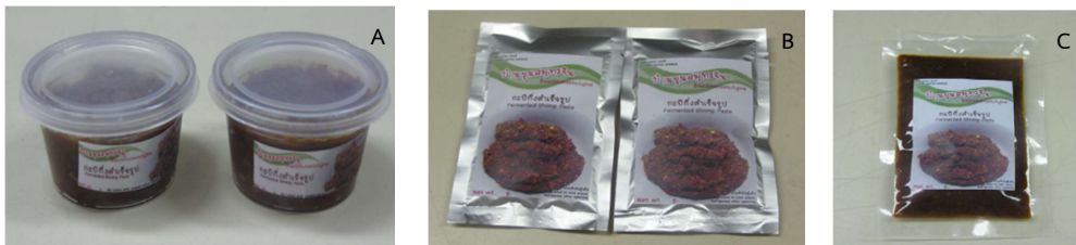
Figure 3 Semi-shrimp paste product at difference packaging

จากการออกแบบและพัฒนาบรรจุภัณฑ์ของผลิตภัณฑ์ต้นแบบกะปิสำเร็จรูปมี 3 รูปแบบ คือ บรรจุในกระปุกพลาสติก ถุงพอยล์ และถุงพลาสติก ภาพที่ 3 (Figure 3)