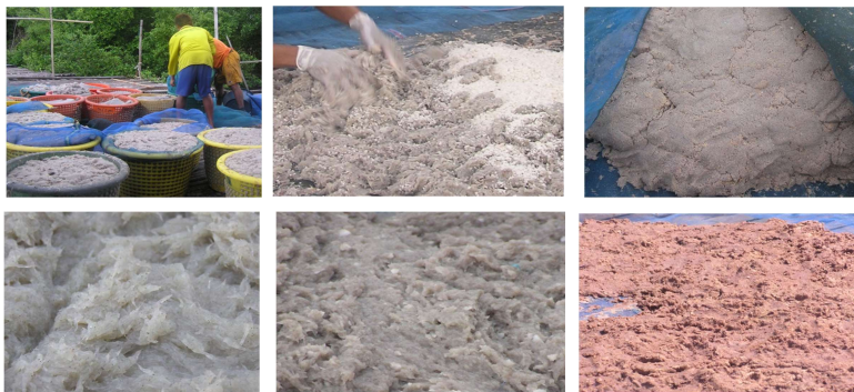
Figure 1 The processing of shrimp paste product

การผลิตกะปิ เริ่มจากการนำเคย (เคยดำ, เคยหางแดงหรือเคยรอง) มาทำความสะอาดโดยวิธีการล้างในน้ำ (เหวียงประกอบการหมุน) ยกขึ้นตั้งไว้ให้สะเด็ดน้ำ แล้วเทลงในพื้นที่ที่เตรียมไว้ นำเกลือเม็ดโรยแล้วคลุกเคล้าให้ทั่วในอัตราส่วนเกลือต่อเคย เท่ากับ 1 ต่อ 6 จนได้ที่โดยสังเกตตัวเคยจะเป็นสีชมพู นำมาเกลี่ยให้หนาประมาณ 1 นิ้ว ผึ่งแดด 1-3 วัน จนเนื้อเคยมีลักษณะแห้งเกาะตัวและมีสีเข้มขึ้น จากนั้นจะนำมาใส่โถงหรือถังซีเมนต์ปิดฝาหมักประมาณ 2-4 เดือนระหว่างหมักน้ำเคยจะซึมออกมาและจะตักน้ำเคยเก็บไว้สำหรับประกอบอาหารแทนน้ำปลา กรณีที่เป็นเคยหางแดงหรือเคยรอง เมื่อหมักเนื้อเคยแล้วจะผึ่งแดดจนแห้งแล้วนำไปตำหรือโกลกให้ละเอียด ปัจจุบันใช้เครื่องบดกะปิที่ได้จากเคยหางแดงหรือเคยรองเพื่อให้เนื้อกะปิแน่นและผสมผสานเป็นเนื้อที่เนียน กะปิที่ได้จะมีรสดี สีสธรรมชาติ ซึ่งเป็นเอกลักษณ์ของผลิตภัณฑ์กะปิ ของชุมชนบ้านขุนสมุทรจีน จังหวัดสมุทรปราการ ดังภาพที่ 1 (Figure 1) ซึ่งผลการวิเคราะห์คุณภาพด้านจุลินทรีย์ของผลิตภัณฑ์กะปิ ดังตารางที่ 2 (Table 2) พบว่า ปริมาณจุลินทรีย์ทั้งหมด Coliform, E. coli , Fecal Coliforms, ที่พบในผลิตภัณฑ์ไม่เกินมาตรฐานผลิตภัณฑ์ชุมชน และไม่พบเชื้อยีสต์ Staphylococcus aureus และ Samonella spp.