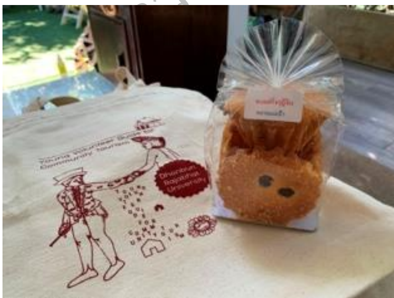
Picture of Kanom Farang Kudichin

as well as the well-known “Kanom Farang Kudichin”.