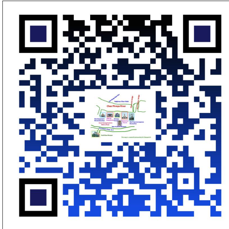
ภาพที่ 4 คิวอาร์โค้ดของหน้าโฮมเพจของเว็บไซต์

-โปรแกรมสร้างคิวอาร์โค้ดสำเร็จรูป QR CODE MONKEY ในการสนับสนุนให้เข้าถึงเว็บไซต์ ที่สร้างขึ้นอย่างสะดวกและรวดเร็ว