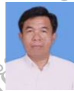
ประหัด คำแก้ว อบรมและพัฒนา