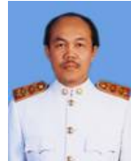
โสภณ ชxaeก ข้อมูลแปรสัญญา และการถือหุ้น