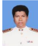
สำเรึง สุนทรแสง สวัสดิการและ ค่าตอบแทน