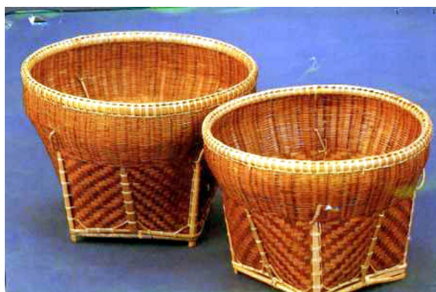
ภาพที่ 4.1 แสดงลักษณะของกระจุง

1.1 กระจุง เป็นเครื่องจักสานที่ใช้สำหรับเก็บข้าวและเมล็ดพันธุ์พืช ลักษณะเป็นเครื่องจักสานทรงกลม ปากกว้าง ด้านก้นเป็นรูปสี่เหลี่ยมมีขาเป็นไม้ไผ่แข็งทั้ง 4 ขา มีหลายขนาดทั้งเล็กและใหญ่ ใช้ไม้ไผ่สานตาถี่ ปากกระจุงและขอบปากสานเก็บด้วยหวายเป็นสิริธรรมชาติ ทาเคลือบด้วยชันหรือเชลแลค จากการสำรวจพบว่าเป็นกระจุงเก่าไม่ค่อยได้ใช้งาน บางบ้านมีสภาพเก่า บางบ้านยังพอใช้งานได้