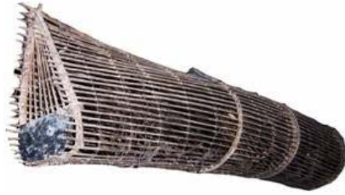
ภาพที่ 4.21 แสดงลักษณะของลอบนอนแบบหาง

3.4.3 ลอบนอนแบบถี เป็นอุปกรณ์จับปลาสำหรับดักปลาในน้ำตื้น รูปทรงเป็นทรงกระบอก มีโครงสร้างภายนอก ลำตัวทำด้วยไม้ไผ่ วัสดุมัดขอบเป็นเชือก โครงสร้างไม้ไผ่ ลวดลายลำตัวลายกระดุก