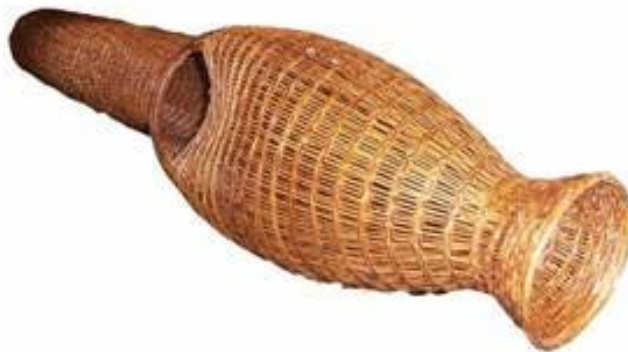
ภาพที่ 4.16 แสดงลักษณะของไซดักปลา

3.2 ไซ เป็นเครื่องมือสำหรับดักปลาในน้ำตื้น สานด้วยไม้ไผ่ ลักษณะเป็นรูปทรงกระบอกปลายเรียว ด้านหัวไซสานเป็นปากกลมเพื่อให้ปลาว่ายเข้าไปได้แต่ว่ายกลับออกมาไม่ได้ มีโครงสร้างภายใน วัสดุมัดขอบเป็นหวาย วัสดุโครงสร้างเป็นไม้ไผ่ ลวดลายลำตัวลายปลอกห้า ลายขอบปากแบบการดัก