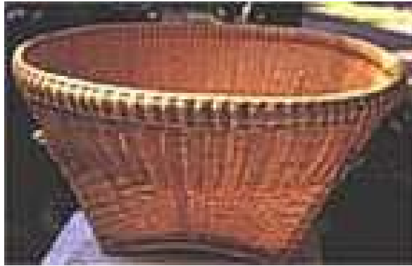
ภาพที่ 4.2 แสดงลักษณะของกระจาด

1.2 กระจาด เป็นเครื่องจักสานด้วยไม้ไผ่ ลักษณะที่พบเป็นการสานแบบตาห่าง ใช้สำหรับใส่พืชผักผลไม้ รูปทรงกลมปากกว้าง ก้นทรงสี่เหลี่ยมและหกเหลี่ยม มีขนาดทั้งเล็กและใหญ่ ลักษณะของสีเป็นสีไม้ไผ่ตามธรรมชาติ ทาห้ด้วยเชลแลคหรือแลคเกอร์ จากการสำรวจพบว่า มีทั้งกระจาดเก่าและกระจาดใหม่