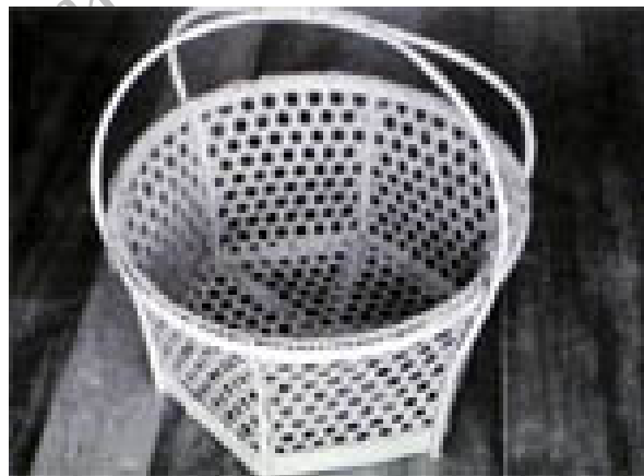
ภาพที่ 4.3 แสดงลักษณะของตะกร้า

1.3 ตะกร้า เป็นภาชนะสานโปร่งลายฉลุ สานด้วยไม้ไผ่ผ่าซีกเหลาเป็นดอกเส้นกลมๆ เส้นยาวๆ สานรอบๆ โครงตะกร้า มี 2 หู สานด้วยหวายเส้น ลักษณะปากกลม ตัวและก้นเป็นรูปหกเหลี่ยม ถ้าเป็นตะกร้าใบใหญ่ จะใช้ในการหาบสิ่งของ ส่วนตะกร้าใบเล็ก ใช้หิ้วสำหรับใส่สิ่งของเวลาไปจ่ายตลาด หรือเก็บข้าวของที่บ้าน ลักษณะของสีเป็นสีไม้ไผ่ตามธรรมชาติ ทาห้ด้วยเชลแลคหรือแลคเกอร์ จากการสำรวจพบว่า มีทั้งตะกร้าเก่าและตะกร้าใหม่