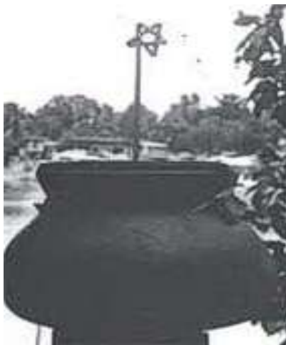
ภาพที่ 4.24 แสดงลักษณะการปักเฉลวบนหม้อยา

4.4.1 ใช้ในการแพทย์แผนโบราณ ว่ากันว่าหม้อที่บรรจุยาถ้าไม่ลงคามี เฉลวปักกันไว้ เมื่อผ่านบ้านหม้ออื่นหรือคนหรือสิ่งใดที่ถือ อาจทำให้เครื่องยาที่มีอยู่ในนั้นเสื่อม คุณภาพหายความศักดิ์สิทธิ์ หรือกันไม่ให้ใครเติมอะไรลงไปหรือกันอะไรที่จะไปทำลายยาให้ เสียไป ดังนั้นจึงต้องปักเฉลวไว้