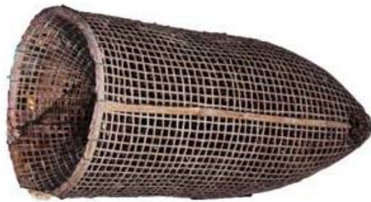
ภาพที่ 4.20 แสดงลักษณะของลอบนอนแบบสาน

3.4.1 ลอบนอนแบบสาน เป็นภาชนะจักสานสำหรับดักปลาในน้ำลึก ลักษณะเป็นรูปทรงกระบอกปากกลมซึ่งเป็นทางเข้าของปลา สานเป็นรูปกรวย ปลาเข้าได้出不ได้ เอาปลาออกทางก้นลอบซึ่งมีที่ปิด-เปิดได้ มีเส้นผ่านศูนย์กลางประมาณ 50 เซนติเมตร ยาวประมาณ 1.00-1.50 เมตร ไม่มีโครงสร้าง ลำตัวทำด้วยไม้ไผ่ วัสดุมัดขอบทำด้วยเชือก โครงสร้างเป็นไม้ไผ่ ลวดลาย ลำตัวลายขัดตาโปร่ง ลายขอบปากแบบการผูก