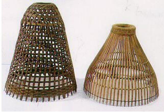
ภาพที่ 4.15 แสดงลักษณะของส้อมดักปลา

3.2 ไซ เป็นเครื่องมือสำหรับดักปลาในน้ำตื้น สานด้วยไม้ไผ่ ลักษณะเป็นรูปทรงกระบอกปลายเรียว ด้านหัวไซสานเป็นปากกลมเพื่อให้ปลาว่ายเข้าไปได้แต่ว่ายกลับออกมาไม่ได้ มีโครงสร้างภายใน วัสดุมัดขอบเป็นหวาย วัสดุโครงสร้างเป็นไม้ไผ่ ลวดลายลำตัวลายปลอกห้า ลายขอบปากแบบการดัก