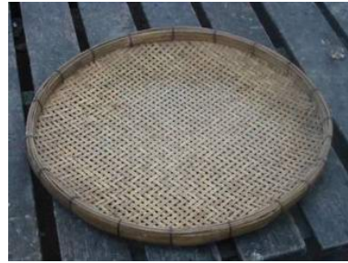
ภาพที่ 4.11 แสดงลักษณะของตะแกรง

2.5 หวดนึ่งข้าวเหนียว เป็นภาชนะจักสาน ใช้สำหรับนึ่งข้าวเหนียว หรือตัดแปลงเป็นเครื่องใช้อย่างอื่น เช่น ประดิษฐ์เป็นโคมไฟตกแต่งร้าน ประดิษฐ์เป็นหน้ากากแสดงผีตาโขนและสิ่งอื่นได้อีกมากมาย ลำตัวสานด้วยไม้ไผ่สลาย 3 โดยเริ่มจากจุดกึ่งกลาง สานไปข้าง สีเป็นสีไม้ไผ่ธรรมชาติ มี 2 แบบ คือ