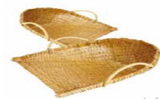
ภาพที่ 4.4 แสดงลักษณะของปุ้งกี

1.4 ปุ้งกี เป็นเครื่องจักสานที่เน้นความแข็งแรงและประโยชน์ใช้สอยมากกว่าความสวยงาม สานด้วยผิวไม้ไผ่ ใช้สำหรับโกยเมล็ดพืชหรืออื่นๆ ตามต้องการ สีเป็นสีไม้ไผ่ธรรมชาติ ไม่มีลวดลายมากนัก ขนาดพอเหมาะเพื่อสามารถยกคนเดียวได้ จากการสำรวจพบน้อยมาก ที่พบส่วนใหญ่จะเป็นปุ้งกีพลาสติก