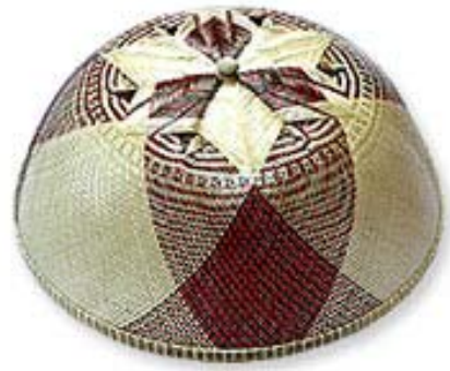
ภาพที่ 4.8 แสดงลักษณะของฝาชี้แบบครึ่งวงกลม