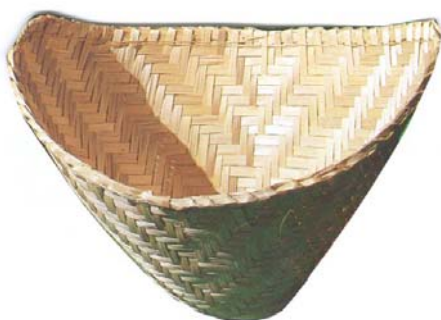
ภาพที่ 4.12 แสดงลักษณะของหวดทรงกรวย

2.5.2 ทรงกลม ใช้นึ่งข้าวเหนียวที่มีปริมาณมากใช้ในงานเลี้ยงขนาดใหญ่ เช่นงานทำบุญเลี้ยงพระ เป็นต้น