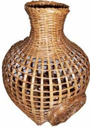
ภาพที่ 4.19 แสดงลักษณะของตะข้องกบ

3.4 ลอบ เป็นเครื่องมือสำหรับดักปลาในน้ำลึก จากการสำรวจที่บ้านหนองเหียงพบว่า มีการใช้ลอบสำหรับดักปลาอยู่ 3 แบบ ดังนี้