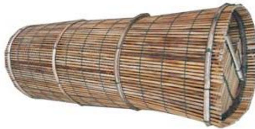
ภาพที่ 4.22 แสดงลักษณะของลอบนอนแบบถี

3.4.3 ลอบนอนแบบถี เป็นอุปกรณ์จับปลาสำหรับดักปลาในน้ำตื้น รูปทรงเป็นทรงกระบอก มีโครงสร้างภายนอก ลำตัวทำด้วยไม้ไผ่ วัสดุมัดขอบเป็นเชือก โครงสร้างไม้ไผ่ ลวดลายลำตัวลายกระดุก