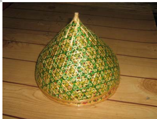
ภาพที่ 4.9 แสดงลักษณะของฝาชี้แบบทรงกรวย

2.4 กระด้ง เป็นภาชนะรูปแบน ขอบกลม ไม่มีโครงสร้างภายใน ใช้ฝัดข้าว เมล็ดพันธุ์พืชหรือใช้ตากของ ลำตัวสานด้วยไม้ไผ่ลายขัดละเอียด ปากขอบกว้าง มีหลายขนาดตั้งแต่เส้นผ่านศูนย์กลาง 1 เมตร 80 เซนติเมตรหรือเล็กกว่านั้น เพื่อให้จับได้ถนัด สานแบบการผูก เป็นสีธรรมชาติทาทับด้วยวานิชหรือแลคเกอร์ ขนาดใหญ่ เรียกว่า กระด้งมอญ