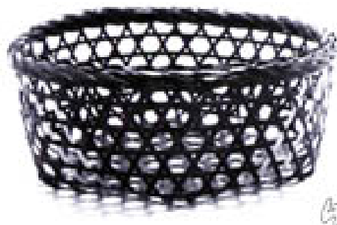
ภาพที่ 4.7 แสดงลักษณะของเ่งแบบตาห่าง

2.3 ฟาชี เป็นภาชนะที่สานด้วยไม้ไผ่ลายละเอียด แต่ไม่ถึงกับทึบหรือแน่น เพราะต้องการให้ระบายอากาศได้ มีเส้นผ่านศูนย์กลางประมาณ 60 เซนติเมตร ใช้สำหรับปิดอาหารที่วางไว้บนโต๊ะหรือบนพื้นบ้าน รูปทรงของฟาชีที่สังเกตพบมีลักษณะทรงกลมผ่าครึ่ง ขอบด้านล่าง