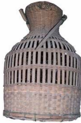
ภาพที่ 4.17 แสดงลักษณะของตะข้องธรรมดาแบบกระบอกขวด

3.3.2 ตะข้องธรรมดาแบบกลม เป็นภาชนะจักสานสำหรับใส่ปลา รูปทรงเป็นทรงกระบอกกลมมีโครงสร้างภายใน ปากเรียวยาวขนาดเส้นผ่านศูนย์กลางประมาณ 12 เซนติเมตร พอให้มือสอดเข้าไปจับปลาออกได้ ก้นเป็นรูปเหลี่ยม ลำตัวทำด้วยไม้ไผ่มีโครงสร้าง วัสดุมัดขอบเป็นหวาย ลวดลายลำตัวลายขัด