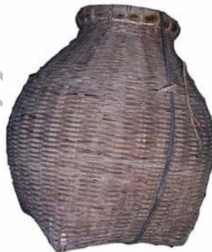
ภาพที่ 4.18 แสดงลักษณะของตะข้องธรรมดาแบบกลม

3.3.2 ตะข้องธรรมดาแบบกลม เป็นภาชนะจักสานสำหรับใส่ปลา รูปทรงเป็นทรงกระบอกกลมมีโครงสร้างภายใน ปากเรียวยาวขนาดเส้นผ่านศูนย์กลางประมาณ 12 เซนติเมตร พอให้มือสอดเข้าไปจับปลาออกได้ ก้นเป็นรูปเหลี่ยม ลำตัวทำด้วยไม้ไผ่มีโครงสร้าง วัสดุมัดขอบเป็นหวาย ลวดลายลำตัวลายขัด