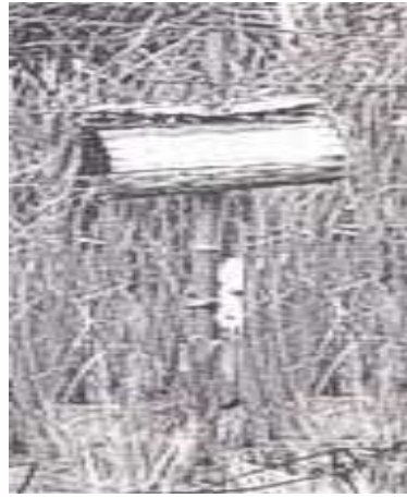
ภาพที่ 4.25 แสดงลักษณะการปักเกลวในนาข้าว

4.4.2 ใช้ปักในนาข้าว การปักเกลวในนาข้าว กระทำเมื่อสิ้นเดือนสิบ ซึ่งเป็นวันสารท ชาวบ้านจะทำกระดาษทนำไปทำบุญที่วัด และเลี้ยงลูกหลาน เมื่อถึงกลางเดือนสิบเอ็ด จะเป็นช่วงที่ชาวนาปักเกลว โดยต้องนำไปปัก ณ ที่นาแปลงใดแปลงหนึ่งของตนในวันศุกร์