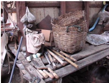
ภาพที่ 4.6 แสดงลักษณะของเ่งแบบตาถี่

เ่งทั้ง 2 แบบไม่มีการแต่งสีและลวดลาย มีหลายขนาด บอกขนาดเป็นเบอร์เบอร์ 2 ขนาดใหญ่ สูงและกว้างประมาณ 58 เซนติเมตร เบอร์ 4 ขนาดกลาง สูงและกว้างประมาณ 42 เซนติเมตร และเบอร์ 6 ขนาดเล็ก สูงและกว้างประมาณ 30 เซนติเมตร จากการสังเกตพบว่าภาชนะดังกล่าวยังมีการใช้งานอยู่เกือบทุกหลังคาเรือน