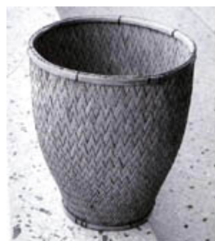
ภาพที่ 4.13 แสดงลักษณะของหวดทรงกลม