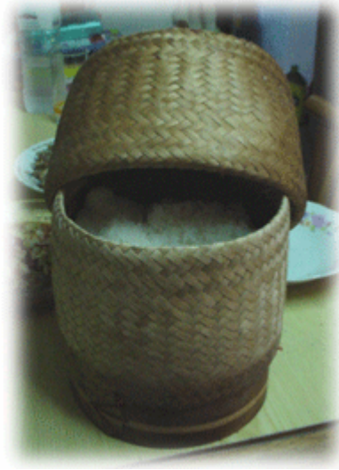
ภาพที่ 4.14 แสดงลักษณะของกระจับปี่ข้าวเหนียว

3. เครื่องมือจับสัตว์น้ำ จากการสำรวจและสังเกตตามบ้านพักอาศัยของชาวบ้านหนองเหียง พบว่าตามบ้านยังมีอุปกรณ์การจับสัตว์น้ำอยู่ ได้แก่