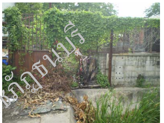
ภาพที่ 4.3 แสดงลำคลองซึ่งมีน้ำเสียสกปรกอยู่ติดกับชุมชนและบ่อที่พักน้ำเสีย