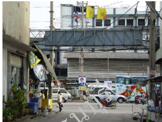
ภาพที่ 4.1 แสดงทางเข้าออกชุมชนศิวนคร ซึ่งติดกับถนนแจ้งวัฒนา