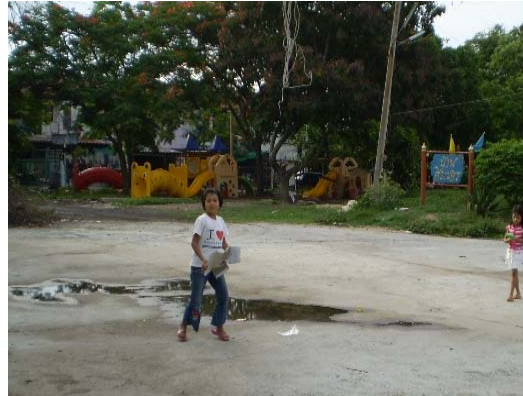
ภาพที่ 4.2 แสดงสนามเด็กเล่น สนามเล่นบาสหรือเล่นบอล