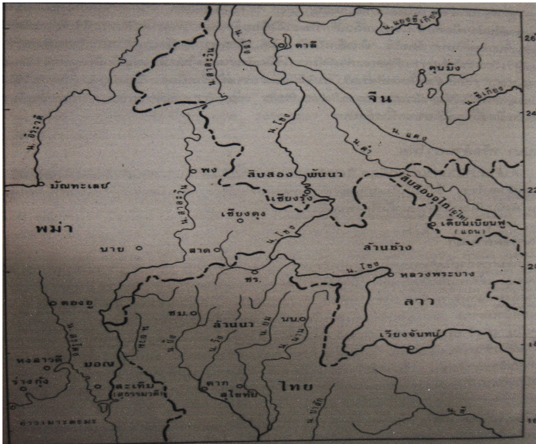
ภาพที่ 1.1 แสดงภาพชุมชนโบราณ

ชาวจีนฮ่อใหญ่จึงกลายเป็นชาวภูไทขาวไป ส่วนที่เหลืออีก 8 เมืองซึ่งเป็น ชาวภูไทอยู่ที่บ้านนาน้อย อ้อยหนู ไม่ได้อยู่ที่เมืองแฉ่งแต่อย่างใด ฉะนั้นชาวภูไทจึงไม่ได้ถูกกวาดต้อนมาในสมัยกรุงธนบุรี เลย และอีกประการหนึ่งชาวเผ่าฮาโล้่มักจะเรียกชาวภูไทว่า “น้องหล้า” (น้องสุดท้อง) เพราะชนชาวภูไทอพยพลงมาจากประเทศจีน เข้าสู่แหลมอินโดจีนเป็นเผ่าท้ายสุด