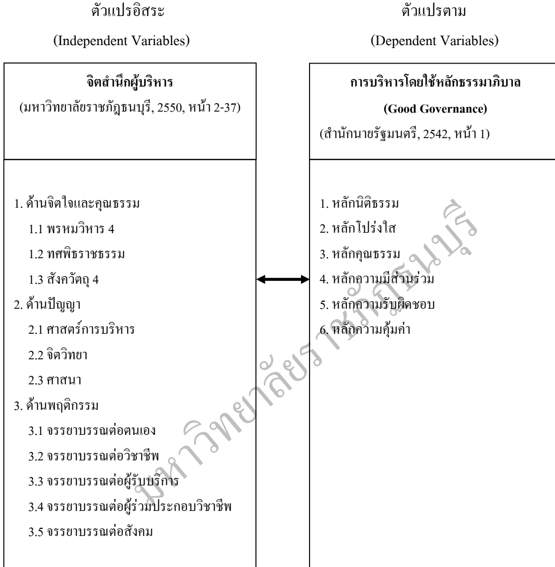
ภาพที่ 1.1 กรอบความคิดเชิงทฤษฎีในการวิจัย