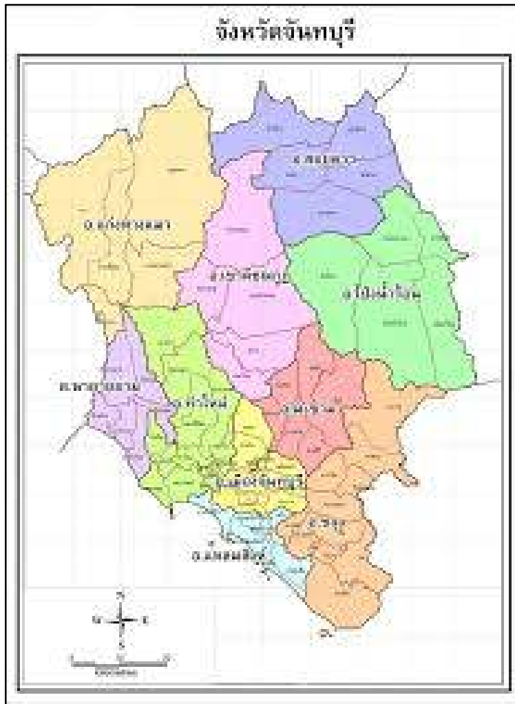
ภาพที่ 1.1 แผนที่จังหวัดจันทบุรี